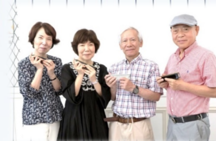
サガン ハーモニカカフェ